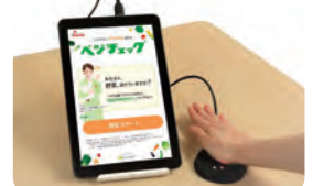
ベジチェック(推定野菜摂取量測定器)